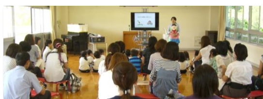
乳幼児の食事講座 子育てサークルにて