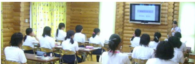
管理栄養士による食育講座 職員研修にて

奈良ヤクルトでは現在、健康応援企業として各地で健康セミナーを実施しております。弊社の 管理栄養士 または 健康管理士 を講師派遣致します。健康に関わる色々な情報を提供し、皆様のお役に立てればと考えております。参加人数は 5人以上で可能 。ヤクルト商品の試飲や、○×クイズなど、楽しい教室です。現在、地域の 学校保健委員会、家庭教育学級、子育てサークル、婦人会、社内研修 などご利用頂いております。奈良県下ならどこでも行かせて頂きますので是非お申し付けください。 (費用無料)